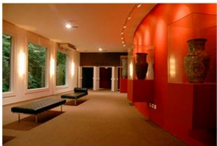
TEATRO SERAFIM GONZALEZ

O teatro Serafim Gonzalez é capaz de receber em um único espetáculo até 513 pessoas, que desde a compra de ingressos até a chegada as suas poltronas percebem a dedicação de todos os envolvidos, que proporcionam atenção em atendimento, estacionamento, hostess gentis, acomodações confortáveis, dispendo inclusive de elevador para portadores de necessidades especiais e foyer para o bate papo de antes e depois. Mas agrada mesmo por sua maravilhosa acústica tanto aos que se apresentam, mas principalmente aos que assistem. Atores, dançarinos e músicos são bem instalados nos camarins.